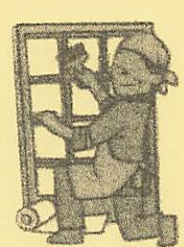
障子張り ふすま・網戸