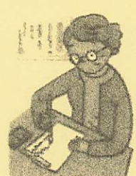
筆耕 (賞状・宛名書き等)